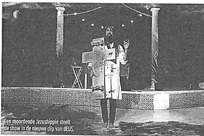
Een moordende Jezushippie steelt de show in de nieuwe clip van dEUS.

Is geloof überhaupt nog iets van deze tijd?