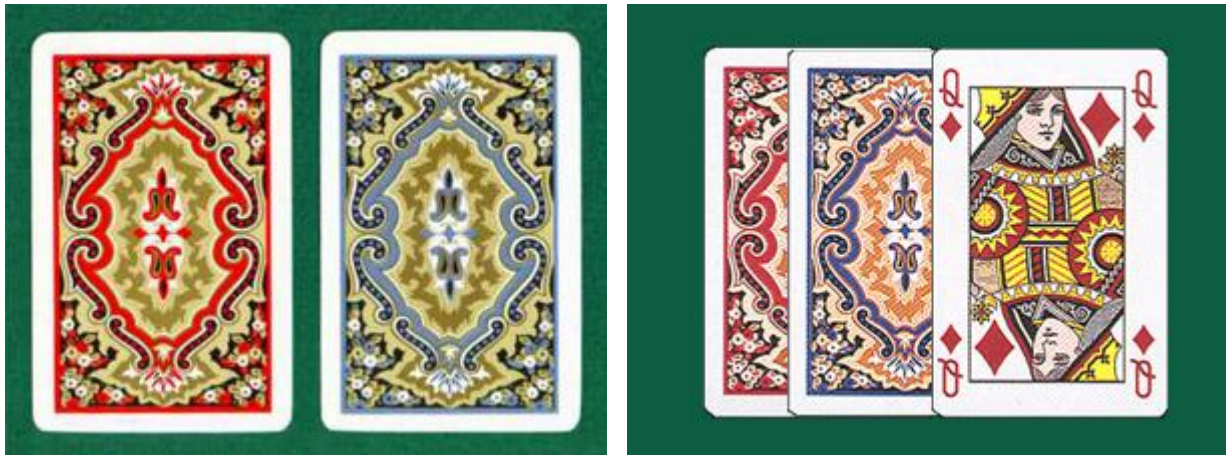
kem-cards met 4 tekens

Tijdens deze jaren werden heroïsche bridgematches georganiseerd, met als hoogtepunt de match tussen Engeland, geleid door Col. Walter Buller, en de USA met Ely Culbertson. Het resultaat van de match leidde ertoe dat Culbertson beschouwd werd als de autoriteit van het spel.