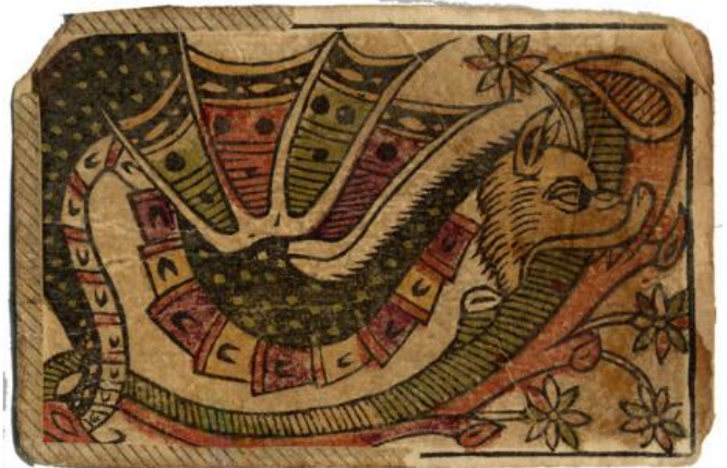
Kaartspel met draken

Giils van den Bogarde maakte dit fraai spel in de gouden eeuw van Antwerpen (1567).