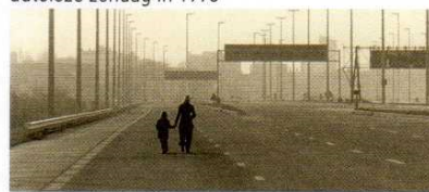
autoloze zondag in 1973