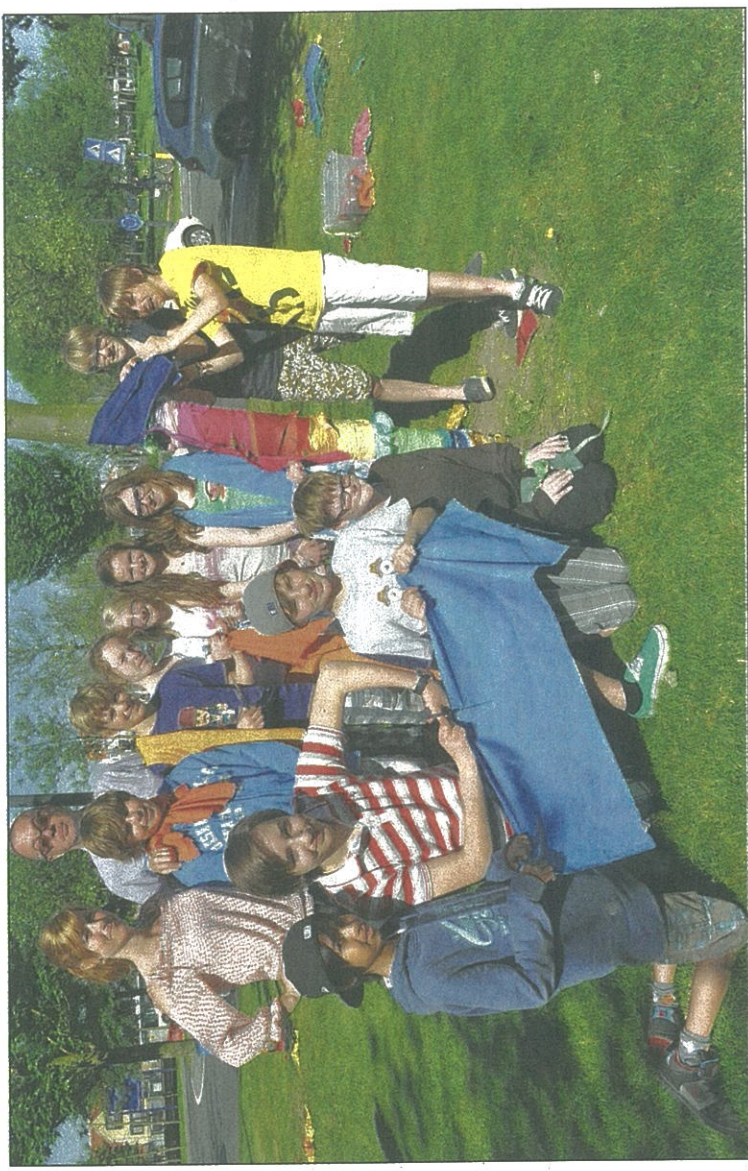
De jongeren toverden de bomen om tot Rainbow Trees.

"Het is heel leuk om te doen. Dit is nu eens een les in open lucht en niet in een leslokaal tussen vier muren. We krijgen ook heel veel reacties van voorbijgangers die het tof vinden dat we zoveel kleur in de straat brengen. Onze kunst valt op", zeggen leerlingen Emmely